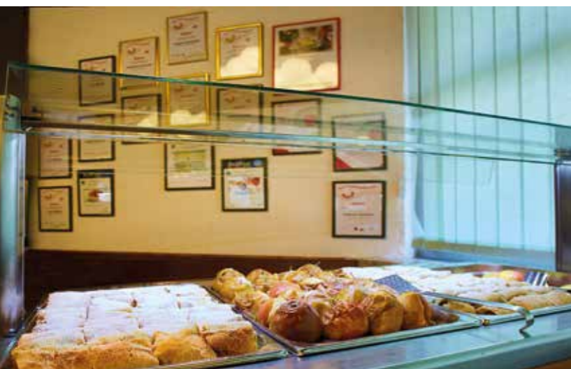
KULINARSKO UMIJEĆE BOLNIČKIH KUHARA NAGRAĐENO JE BROJIM PRIZNANJIMA I MEDALJAMA NA HRVATSKIM PRVENSTVIMA U KULINARSTVU