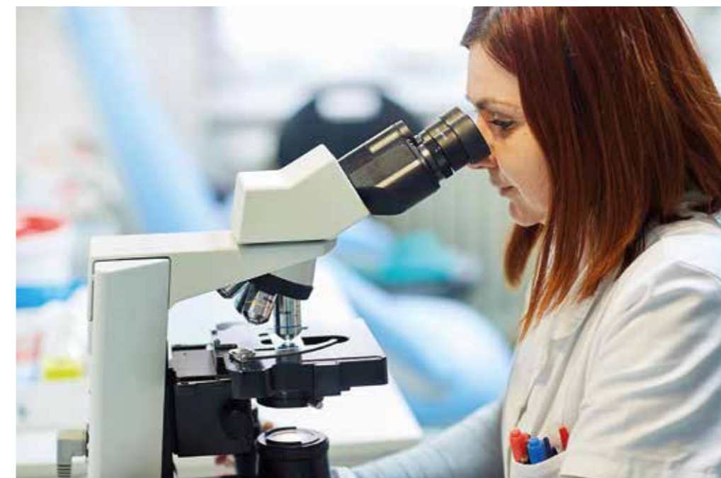
MIKROSKOPSKI PREGLED UZORAKA U MEDICINSKO-BIOKEMIJSKOM LABORATORIJU