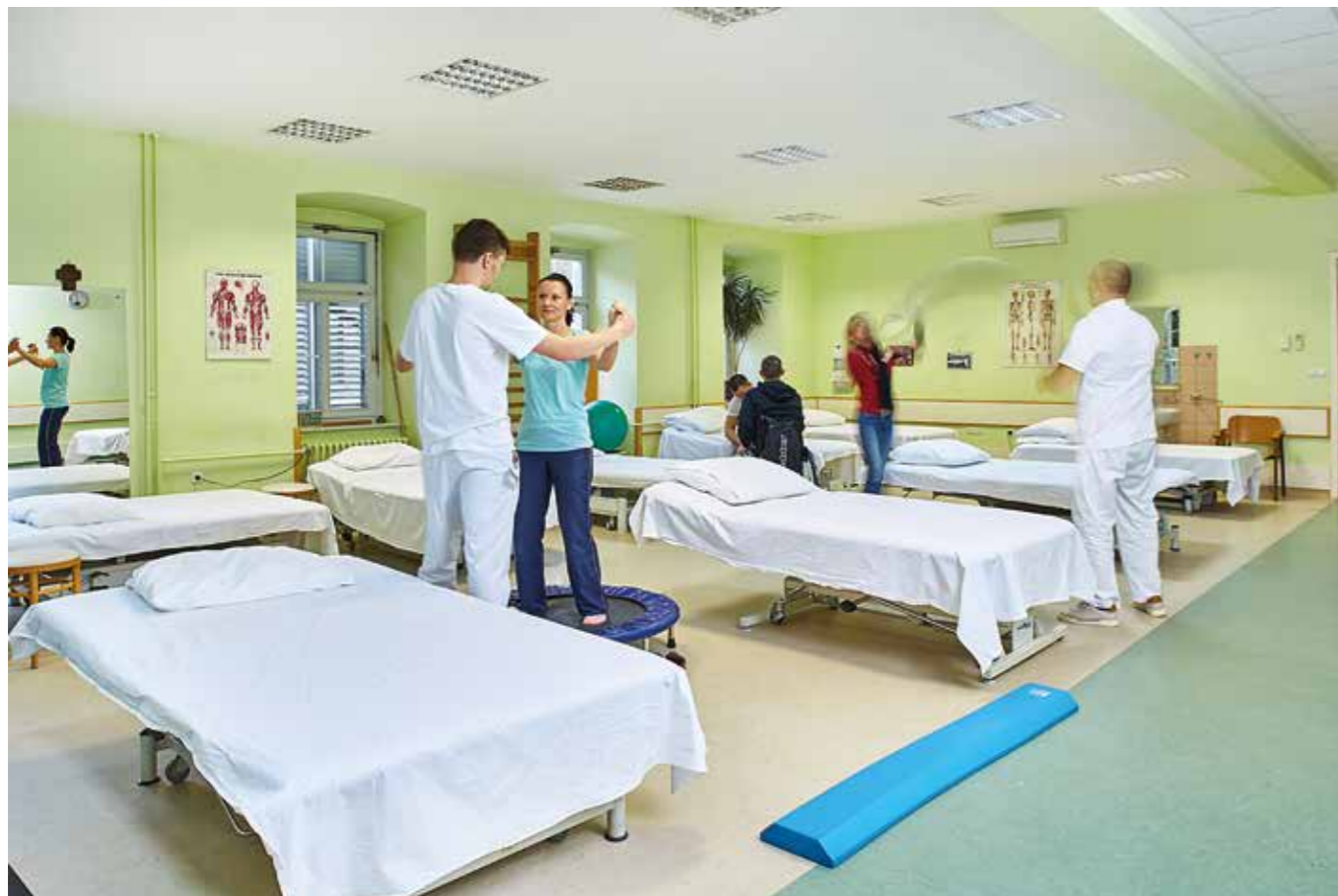
DVIORANA ZA MEDICINSKU GIMNASTIKU