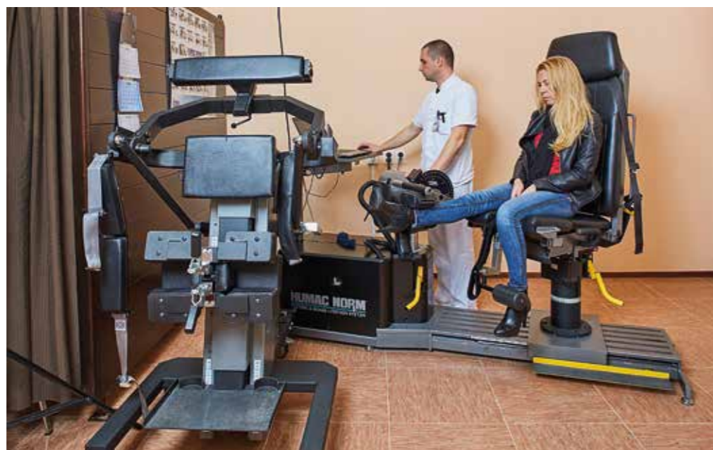
CENTAR ZA BIOMEHANIČKO IZOKINETIČKU DIJAGNOSTIKU I LIJEČENJE

1989. godine, reorganizacijom Odjela za neurološku rehabilitaciju, započinje s radom Odsjek postintenzivne njege, gdje se, po prvi puta, organizirano zaprimaju najteži pacijenti s kranio cerebralnim ozljedama, s poremećajem svijesti (koma, vegetativno stanje, minimalno svjesno stanje), s potrebom intenzivnije neurološke medicinske njege (traheotomirani, s nazogastričnim sondama, urinarnim kateterima) i specifične neurološke rehabilitacije.