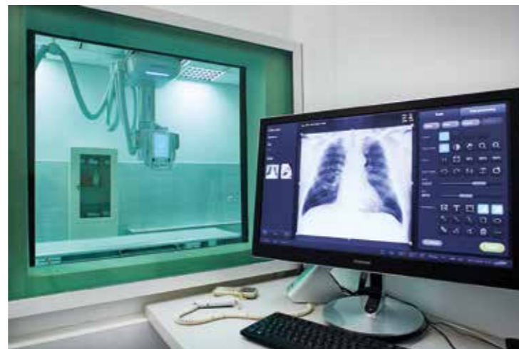
SUVREMENI RTG UREĐAJ