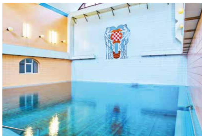
GRB POSTAVLJEN U JAKOBOVOM BAZENU NAKON OBNOVE PROSTORA KUPELJI 1991. GODINE

koje su bile primitivno uređene. Nakon izgradnje Marijine i Jakobove kupelji izgrađeni su blagovalište (Restaurant) i kupališna dvorana (Cursalon). Izgradnja cijelog kupališnog kompleksa, s parkom i šetalištima s alejama divljih kestena i lipa, dovršena je 1866. godine.