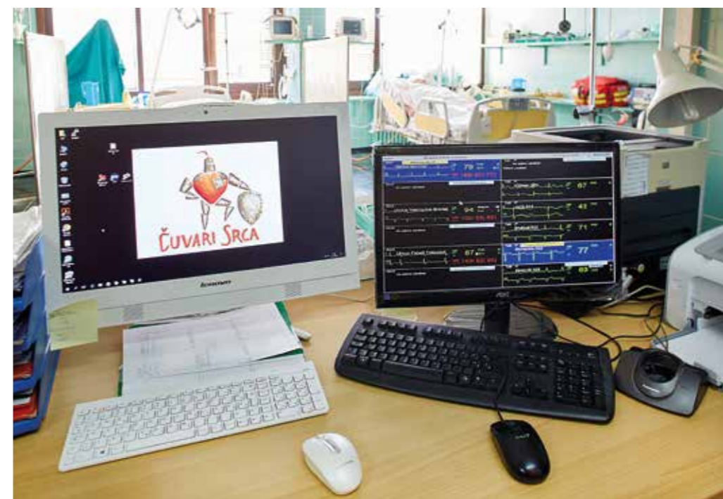
CENTRALNO MONITORIRANJE U JEDINICI INTENZIVNOG LIJEČENJA