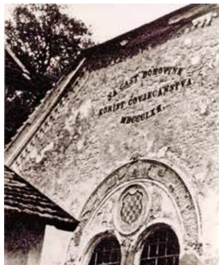
IZVORNI NATPIS NA KUPELJIMA