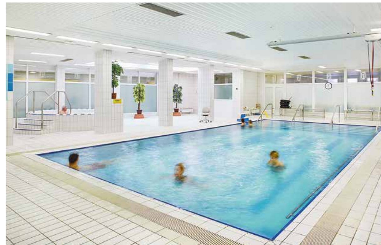
HIDROTERAPIJA U NBO - U NAKON PREUREĐENJA 2007. GODINE

sa 270 kreveta u komfornim, jednokrevetnim i dvokrevetnim, sobama.