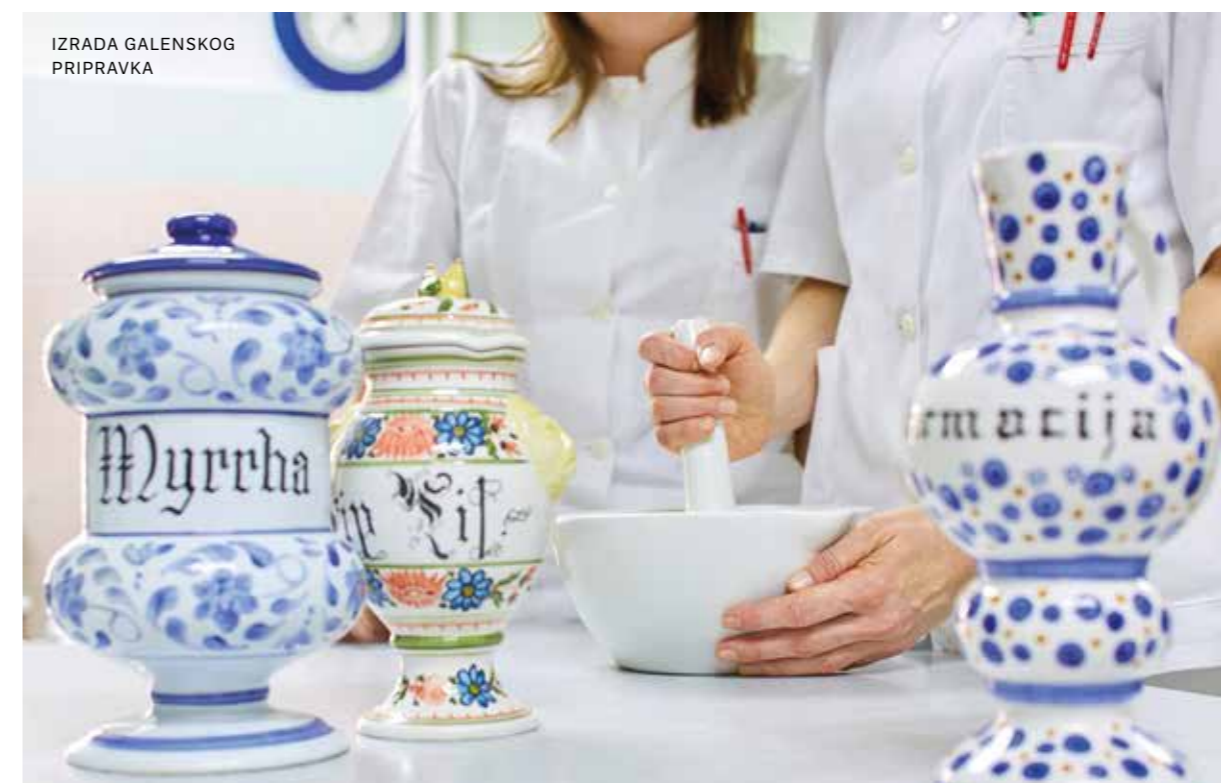
IZRADA GALENSKOG PRIPRAVKA

javne i bolničke ljekarne. Ovaj način opskrbe lijekovima trajao je do kraja 1993. godine kada je, uslijed porasta potrošnje lijekova u Bolnici, udaljenosti Ljekarne od Bolnice i sve brojnijih donacija lijekova Bolnici, uprava Bolnice donijela Odluku o osnivanju ljekarne unutar prostora Bolnice.