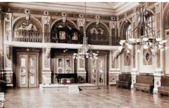
DVORANA KUPALIŠNOG LJEČILIŠTA

NBO je dovršen 1976. godine, a sastoji se od 250 bolničkih soba, hidroterapije u prizemlju, kuhinje