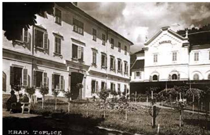
BOLNIČKI PARK U 19. STOLJEĆU

Nakon izgradnje Stare zgrade bolnice, 1865. godine Jakob Badel započeo je s uređenjem parka koji se do danas redovito održava i uređuje.