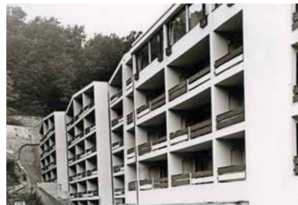
NOVI BOLNIČKI OBJEKT IZGRAĐEN 1976. GODINE