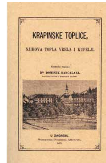
JEDNA OD PRVIH MONOGRAFIJA O KRAPINSKIM TOPLICAMA

U II. svjetskom ratu lječilišne zgrade bile su teško oštećene. Razni uređaji kupališta bili su uništeni, a inventarski predmeti većim dijelom odneseni. Nakon 1945. godine obnovljen je najnužniji inventar i počelo se s poslovanjem, uglavnom, turističko – ugostiteljskog karaktera, dok je zdravstvena služba potisnuta u drugi plan. Ubrzo je u zemlji uočen nedostatak bolničkih kreveta, naročito za kronične reumatske i ortopedske bolesnike, kao i za ratne