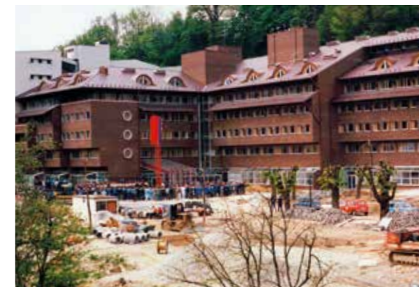
NAJNOVIJI BOLNIČKI OBJEKT IZGRAĐEN 1988. GODINE

i restorana te prostora za terapije na visokom prizemlju. Godine 1988. proširen je restoran i prostor elektroterapije, a 2007. godine je kompletno obnovljena hidroterapija u prizemlju i krovšte. Od smještajnih kapaciteta do sada je obnovljeno 16 soba (2008. i 2013. godine).