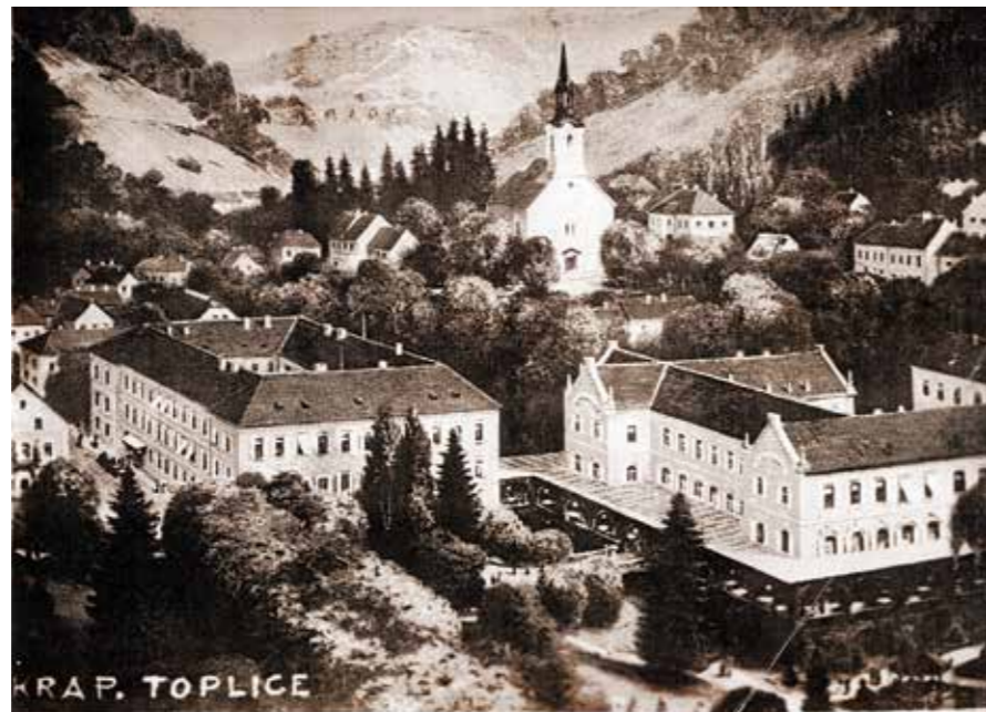
BOLNIČKI OBJEKTI U 19. STOLJEĆU