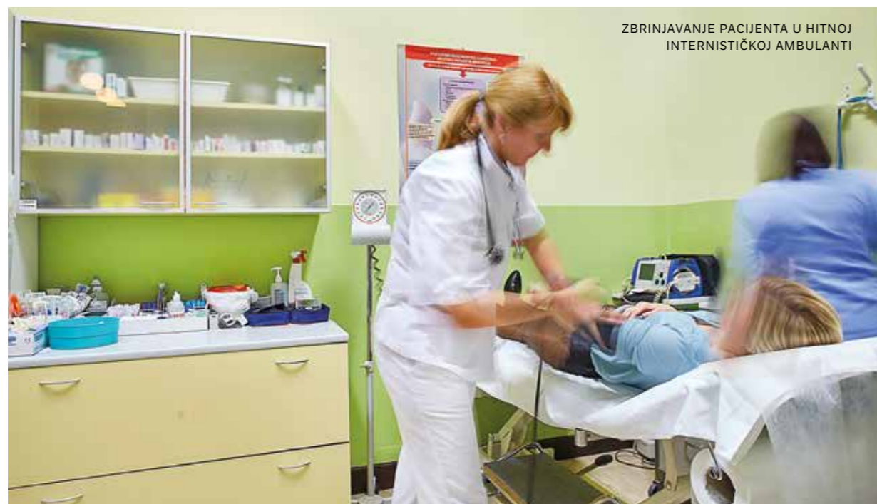
ZBRINJAVANJE PACIJENTA U HITNOJ INTERNISTIČKOJ AMBULANTI

Osoblje Odjela redovito sudjeluje u procesima trajnog stručnog i znanstvenog usavršavanja u skladu s primjenom novih tehnologija i modaliteta intenzivnog liječenja. Primjenjivane metode i postupci intenzivnog liječenja usklađeni su s važećim međunarodnim smjericama i standardima liječenja pojedinih bolesti poštujući medicinu utemeljenu na dokazima. Ovisno o mogućnostima, kontinuirano se radi na osuvremenjivanju medicinske opreme za dijagnostiku, invazivni i neinvazivni monitoring te liječenje intenzivnih bolesnika.